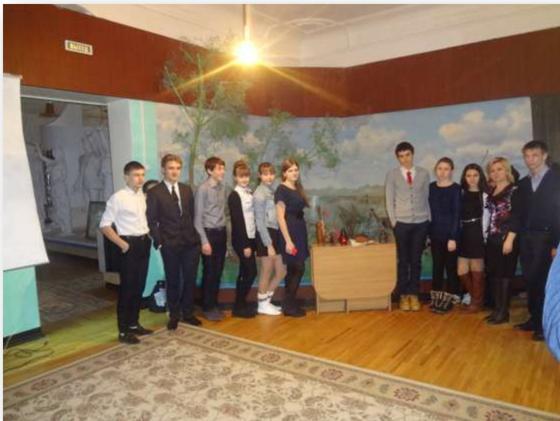
Беседа «Сталинградская битва».